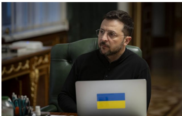
Фото: Володимир Зеленський, президент України

Обирайте перевірене - додайте РБК-Україна до улюблених джерел у Google