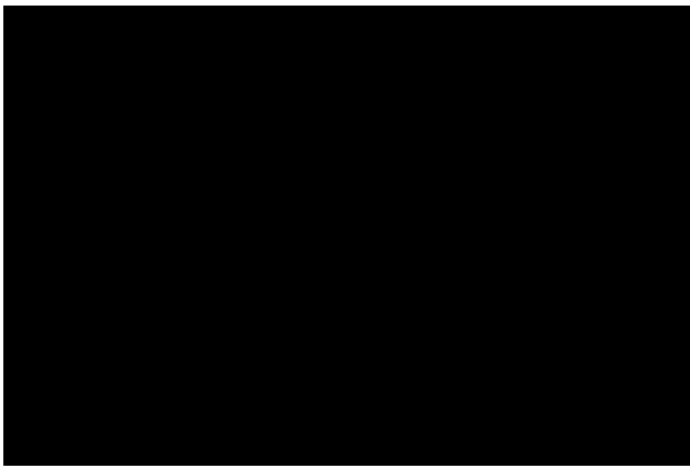
Фото: дрон упав на тролейбусне депо ( t.me/dnipropetrovskaODA )