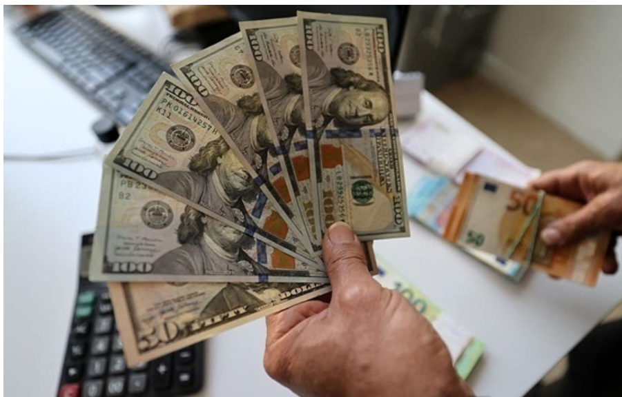
Обмінники купують долар у середньому по 43,75 гривні

Середній курс продажу долара зріс до 43,88 гривні, а курс продажу євро піднявся до 51,73 гривень.