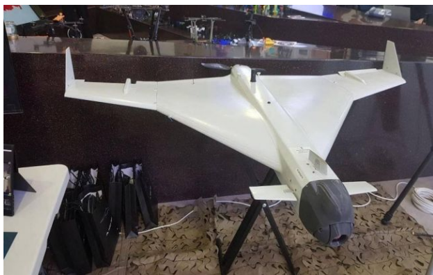
Фото: дрон "Клин", яким Росія атакує Україну (t.me/serhii_flash)

Обирайте перевірене - додайте РБК-Україна до улюблених джерел у Google