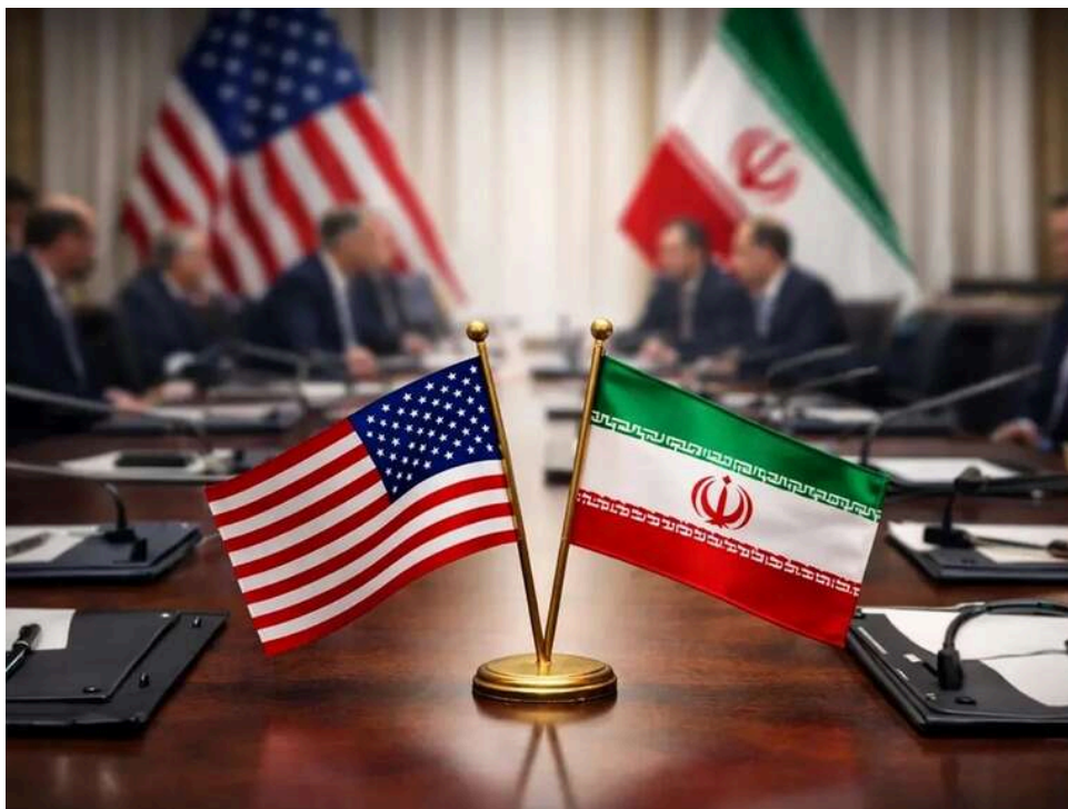
Дипломатія як прикриття: Іран побоюється раптового удару США під виглядом мирних переговорів

Іран побоюється нових ударів з боку США під виглядом відновлення переговорів.