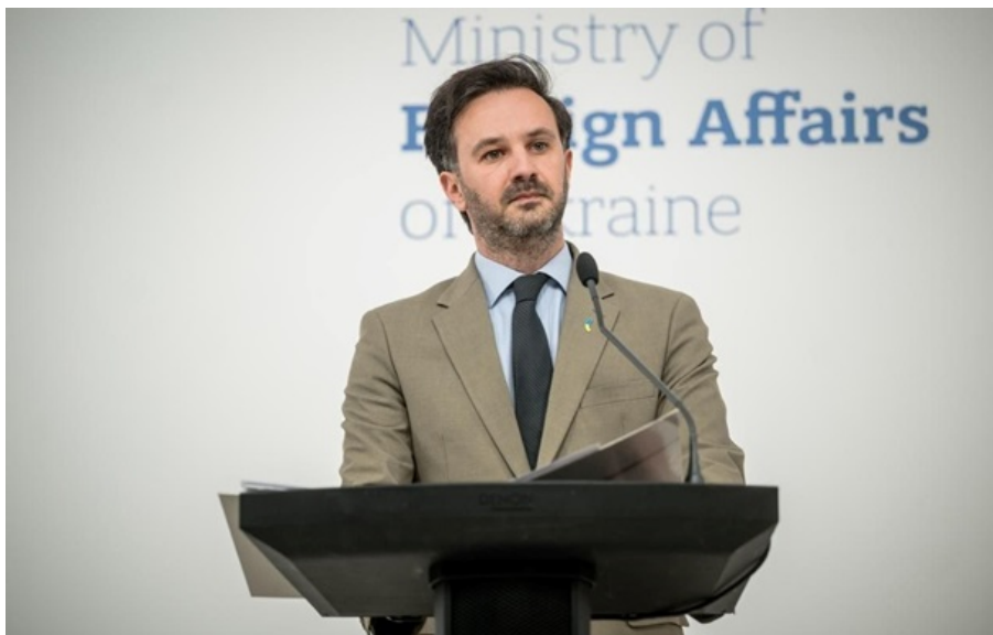
Фото: МЗС України Георгій Тихий прокоментував інцидент з вибухівкою у Сербії

Найімовірніше, це російська операція під чужим прапором у межах активного втручання Москви у вибори в Угорщині, наголосили в українському відомстві.