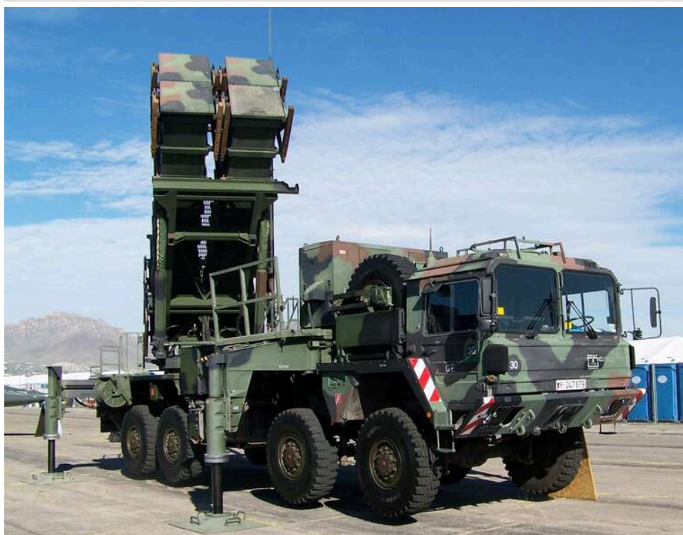
Війна в Україні стала навчальним кейсом для іранських військових, - Financial Times

Іран кілька років аналізує війну в Україні, щоб зрозуміти, як вести сучасні бойові дії. Реальні уроки конфлікту детально розбираються на сторінках оборонних видань країни.