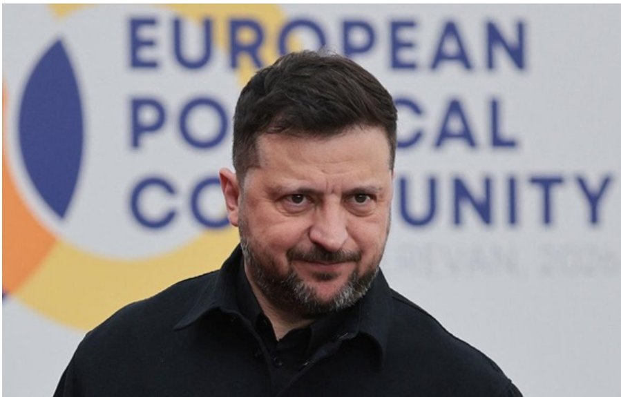
Володимир Зеленський на саміті в Єревані 4 травня

Потрібно і далі тиснути на Росію за допомогою санкцій, і також продовжувати підтримку України, зазнаив глава держави.