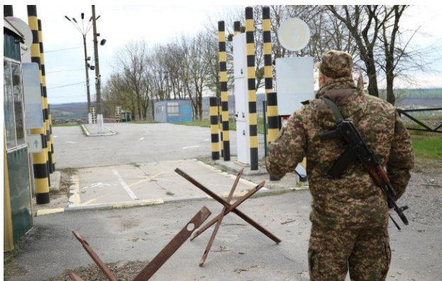
Фото: військові посилюють оборонні рубежі на напрямку Придністров'я

Обирайте перевірене - додайте РБК-Україна до улюблених джерел у Google