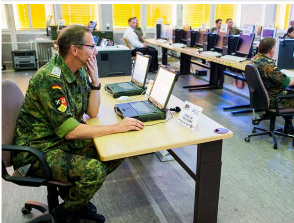
Цифрова "завіса": Міноборони Німеччини заборонило смартфони через загрозу шпигунства з боку Росії та КНР

У будівлі німецького Міністерства оборони де-факто запровадили заборону на використання особистих мобільних пристроїв.