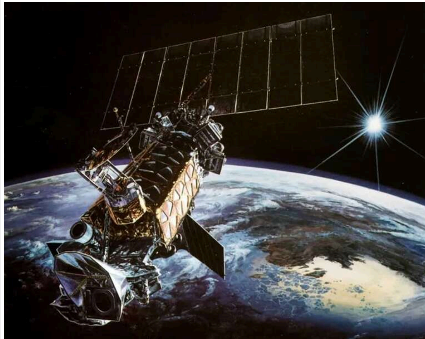
Навчання Apollo Insight: як США та союзники готуються до відбиття ядерної атаки в космосі

США готуються до космічної загрози: навчання Apollo Insight і небезпека «відключення» супутників.