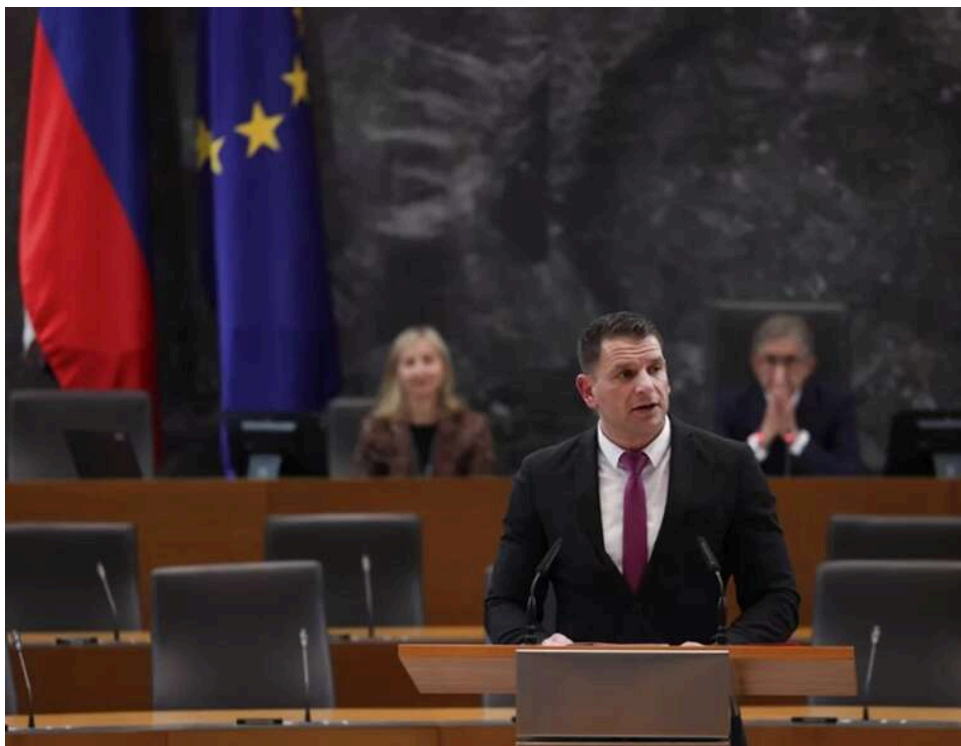
Курс на Кремль: голова парламенту Словенії планує візит до Москви та "будівництво мостів" із РФ

Словенія може кардинально змінити зовнішню політику – аж до виходу з НАТО. У парламенті Словенії заговорили про можливість винесення цього питання на референдум.