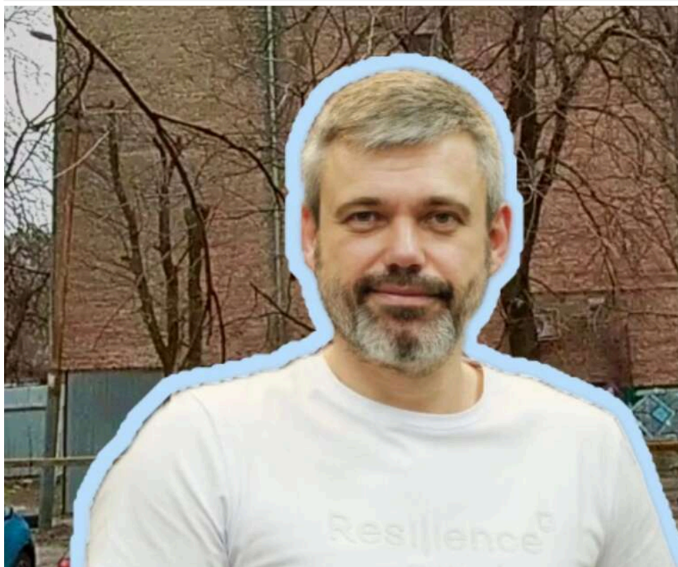
Кінець справи на Жиянській: чи зможе "НВП Рестін" звести хмарочос впритул до Музею видатних діячів після рішення Верховного Суду

Міністерство культури України має розглянути проектну документацію щодо будівництва офісно-житлового та готельного комплексу на вул. Жиянській, 96-А. Таким є результат судового спору, який ще в 2021 році було ініційовано ТОВ "НВП "Рестін", – цій компанії Мінкульт не погодив такі документи "добровільно".