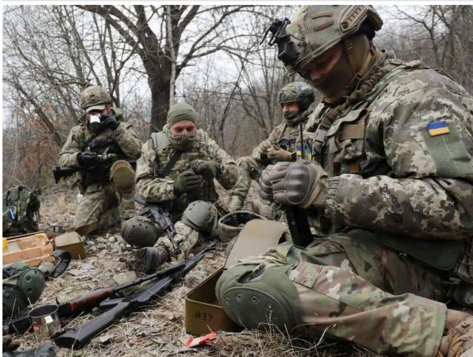
Ситуація на фронті: Зафіксовано 132 боєзіткнення, найбільше на Покровському та Костянтинівському напрямках

За минулу добу на передовій відбулося 132 бойових зіткнення.