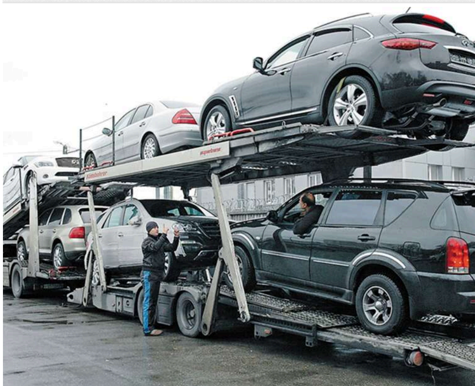
Фіктивні контракти з Угорщиною: директора волинської фірми оштрафували на 300 тисяч за незаконне ввезення авто

Директора волинської фірми оштрафували більш ніж на 300 тисяч гривень за імпорт 8 автомобілів із фальшивими документами.