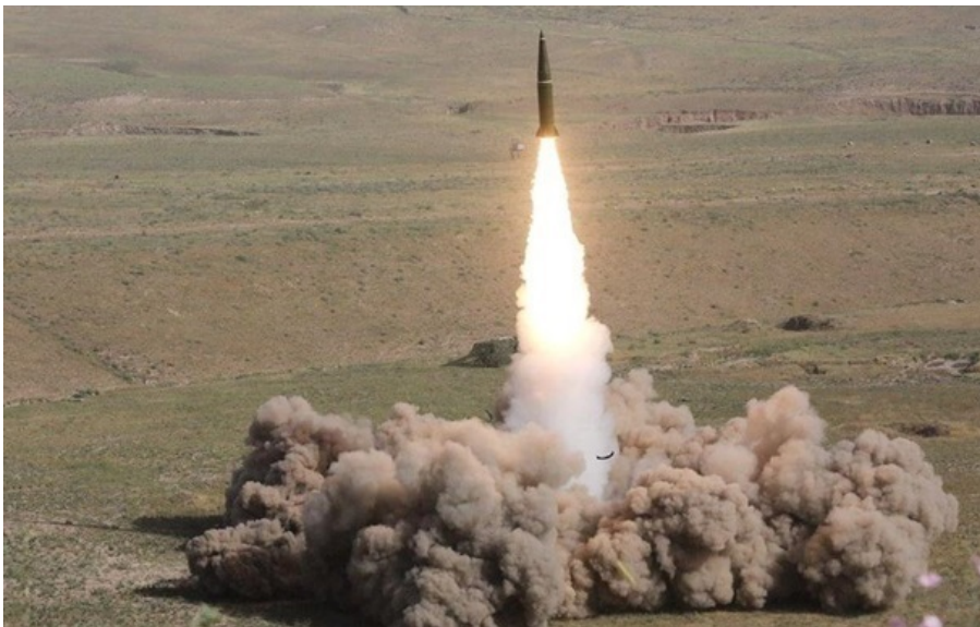
Ворог міг застосувати ракету Іскандер-М

Відомо про загорання приватного будинку та автомобіля. Також пошкоджено інші приватні будинки, магазин і СТО.