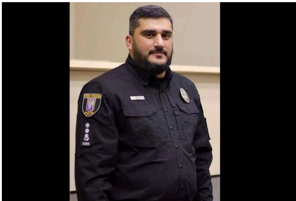
Крах поліцейської вертикалі в Голосієво: чому підлеглі Кочкадамяна відступили перед вбивцею

Вчорашня стрілянина в Голосіївському районі Києва стала не просто НП, а показником реального стану районної поліції.