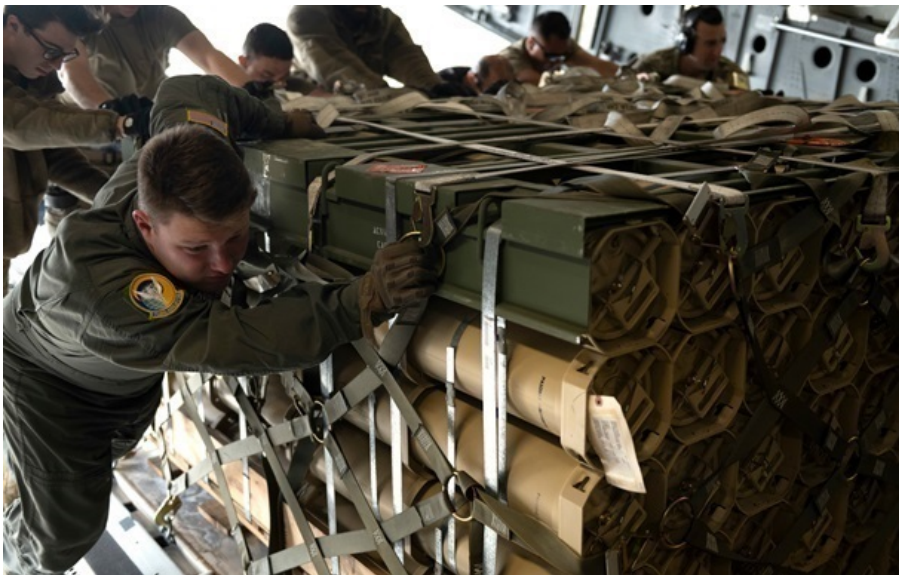
Затримки з постачанням зброї можуть зачепити кілька країн Європи

Особливий акцент робиться на ракетах-перехоплювачах PAC-3 Patriot, які Штати активно використовують для протидії іранським атакам у регіоні Перської затоки.