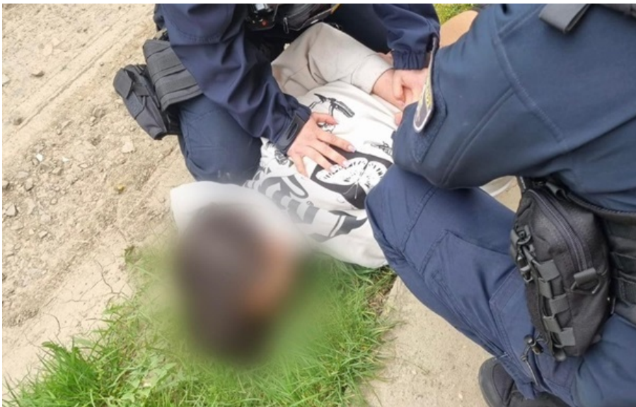
Неповнолітній стрілець міг діяти під психологічним тиском

Підліток міг діяти під впливом та психологічним тиском невстановлених осіб, з якими контактував через один із месенджерів, а познайомився через онлайн-гру.