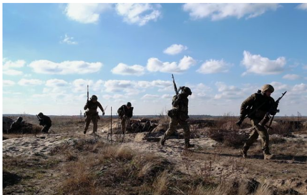
Фото: українські військові на фронті

Обирайте перевірене - додайте РБК-Україна до улюблених джерел у Google