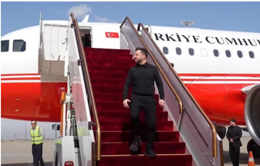
Фото: Скриншот відео Володимир Зеленський у Дамаску

Глава Української держави розпочав візит до Дамаска для обговорення безпеки та економічної співпраці.