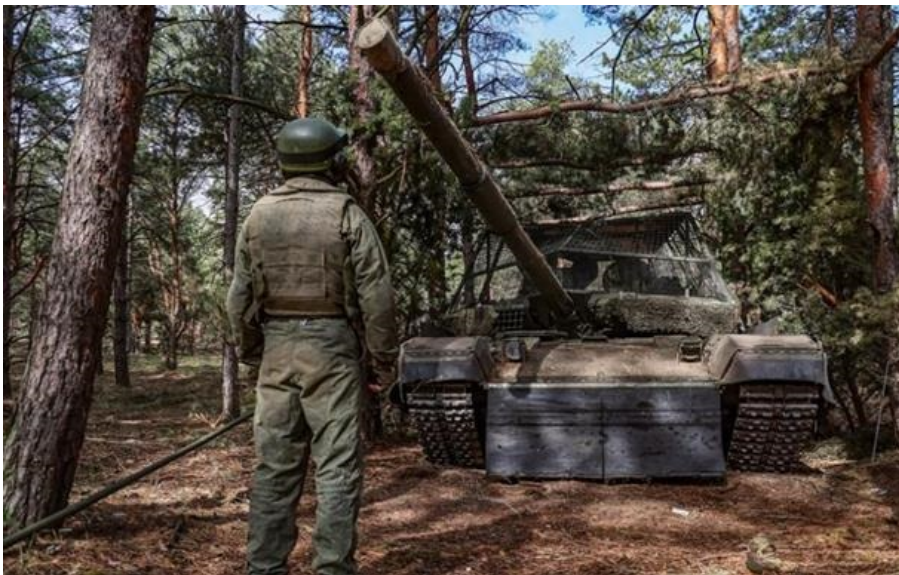
Росія готує новий наступ на південному сході в Україні

РФ прагне захопити весь Донбас до вересня і для цього залучає стратегічні резерви чисельністю 20 тисяч військових.