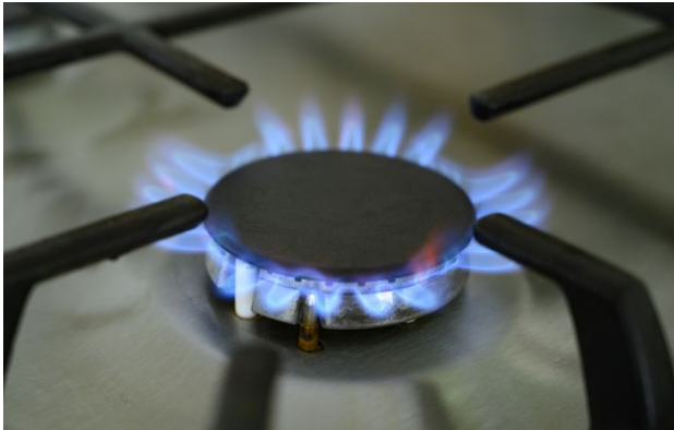
Фото: постачальники газу оновили тарифи для населення (Getty Images)

Обирайте перевірене - додайте РБК-Україна до улюблених джерел у Google