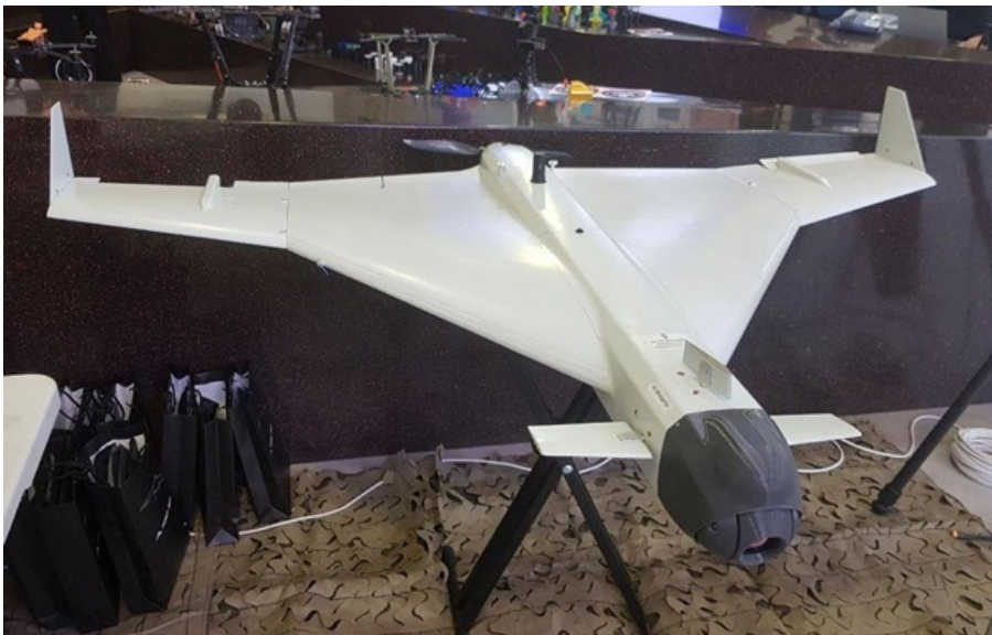
Російський БпЛА зі штучним інтелектом Клин

Важливою відмінністю Клина є використання технології машинного зору з можливістю автоматичного захоплення цілі.