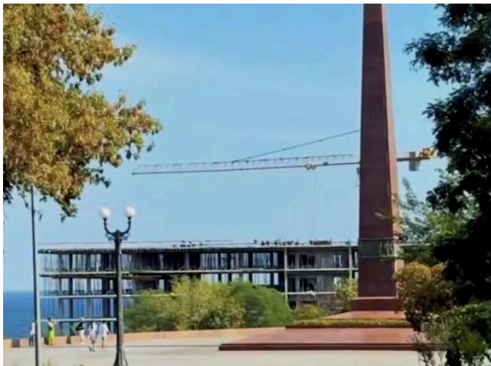
Апартаменти від оточення Галантерніка: в Одесі на Ланжероні незаконно звели 11-поверхівку, що закрила вид на море

Журналісти «Nikcenter» повідомили , що на пляжі Ланжерон в Одесі «росте» новий житловий комплекс, який вже перекрив вид на море з Алеї Слави у парку імені Шевченка.