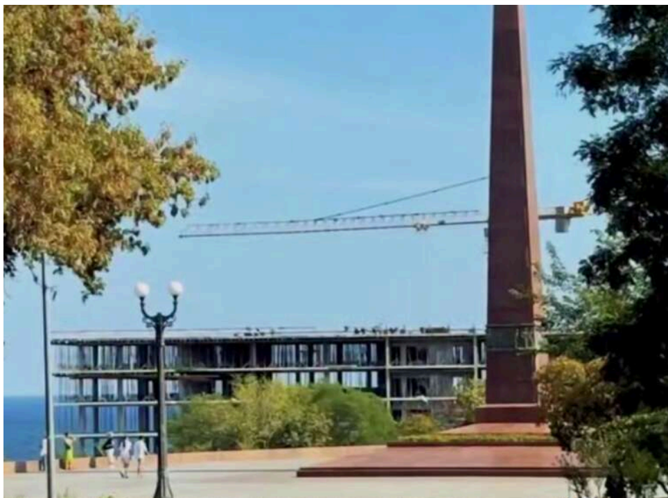
Апартаменти від оточення Галантерніка: в Одесі на Ланжероні незаконно звели 11-поверхівку, що закрила вид на море

Журналісти Nikcenter повідомили , що на пляжі Ланжерон в Одесі росте новий житловий комплекс, який вже перекрив вид на море з Алеї Слави в парку імені Шевченка.