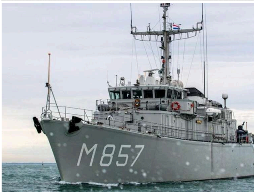
Відродження "Генічеська": Нідерланди в червні передадуть Україні протимінний корабель класу Alkmaar

У червні поточного року Нідерланди передадуть Україні протимінний корабель класу Alkmaar, – повідомив Зеленський.