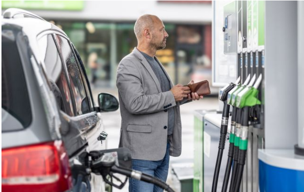
Фото: бензин і дизель подорожчали на АЗС

Обирайте перевірене - додайте РБК-Україна до улюблених джерел у Google