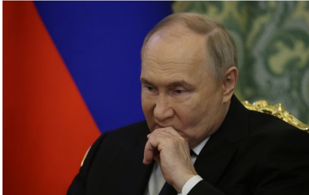
Фото: російський диктатор Володимир Путін

Обирайте перевірене - додайте РБК-Україна до улюблених джерел у Google