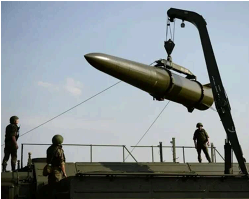
Не копія "Іскандера", але з західними деталями: Міноборони розкрило технічні секрети ракет КНДР

Під час інтенсивних обстрілів українських міст Росія використовує балістичні ракети північнокорейського виробництва серій KN-23 та KN-24. Українські експерти провели лабораторний аналіз їхніх уламків після ударів і з'ясували, наскільки ці боєприпаси є оригінальною розробкою.