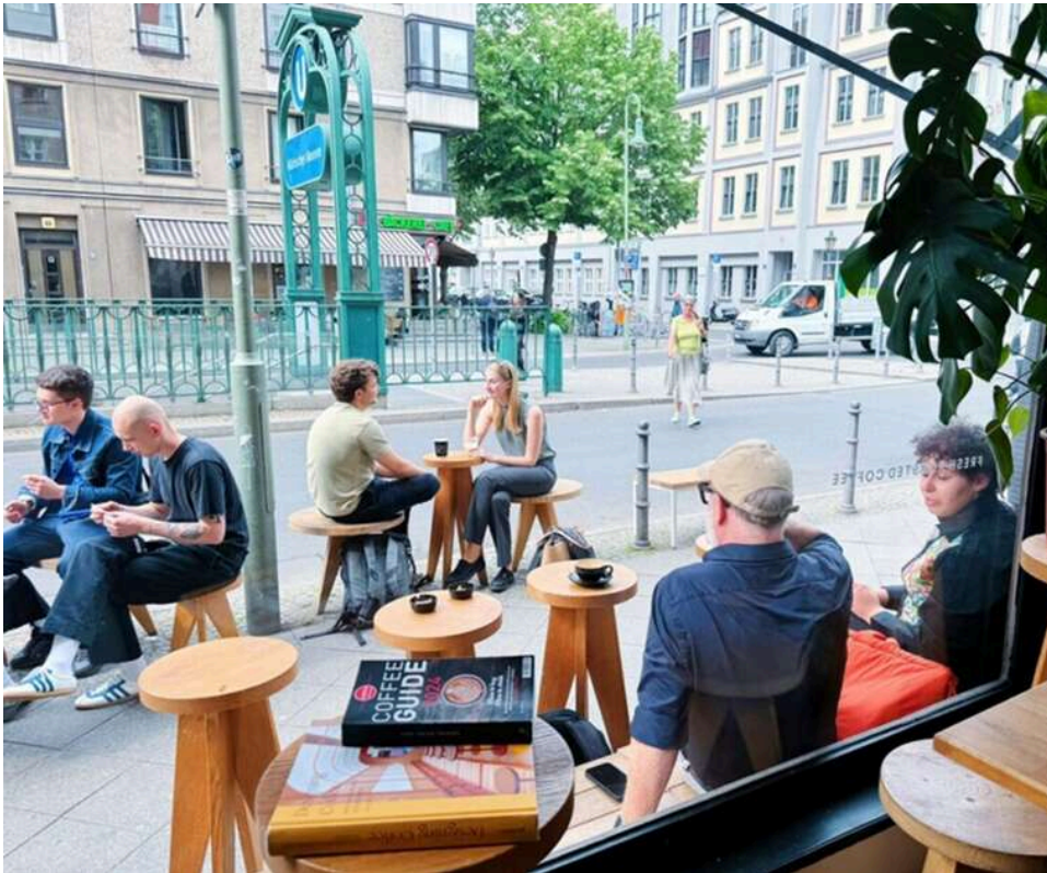
Ресторанний ринок під ударом: чому в Києві та регіонах масово закриваються кав'ярні та стріт-фуд

В Україні масово закриваються заклади громадського харчування.