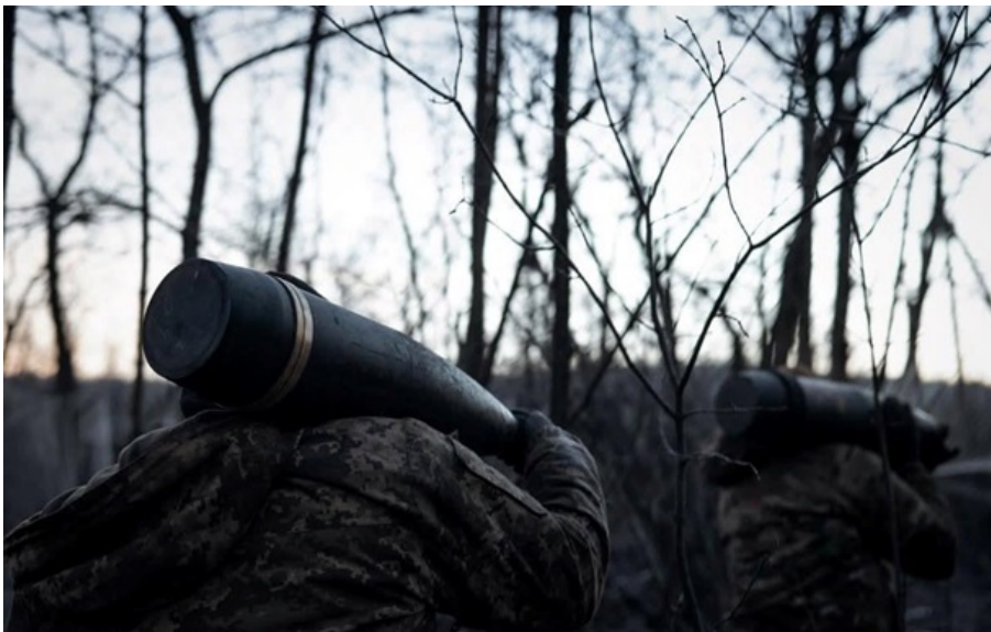
(ілюстративне фото) ЗСУ протистоять армії РФ

Сили оборони відбили одинадцять ворожих штурмів на Костянтинівському напрямку. На Покровському напрямку ворог здійснив 26 атак.