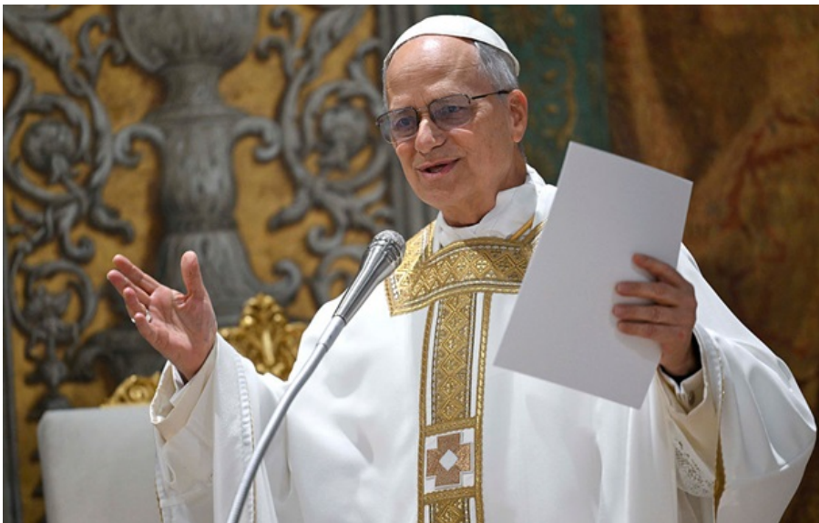
Папа Лев XIV звернувся до світових лідерів

Перший Папа зі США не називає конкретних війн, втім, звертається зі своїм закликом до всіх глав держав і урядів.