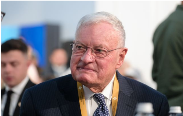
Фото: колишній спецпредставник США з питань України та Росії Кіт Келлог (Віталій Носач, РБК-Україна)

Обирайте перевірене - додайте РБК-Україна до улюблених джерел у Google