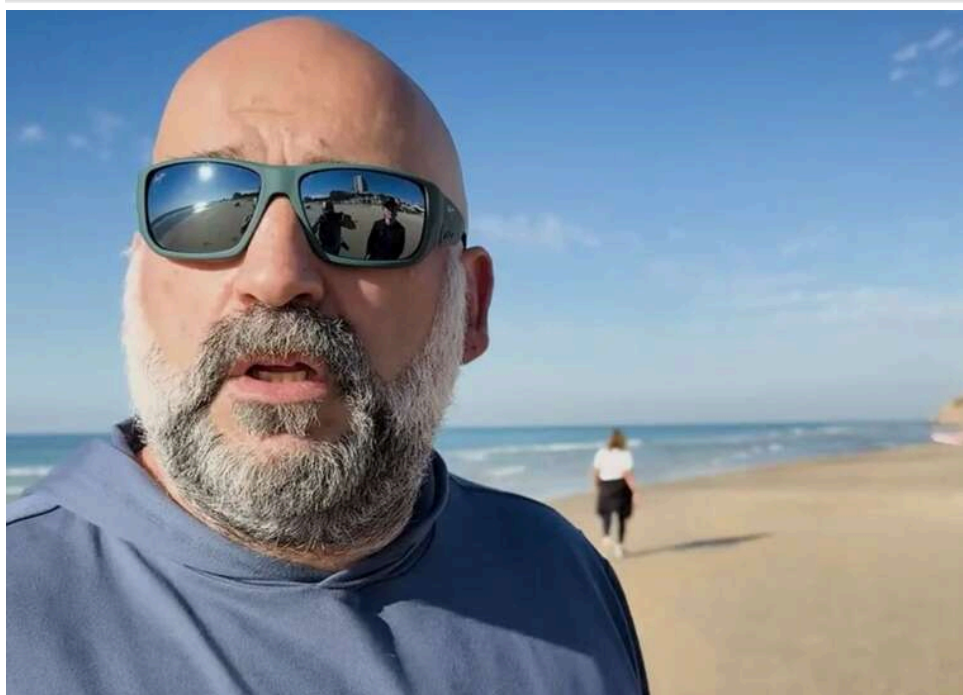
«Плівки Міндича» та витік НСРД: як адвокат Єрмака та нардеп Власенко шукають джерело «зливу»

«Пленки Міндича»: витік зі слідства, публічний конфлікт і натяк адвоката Єрмака.