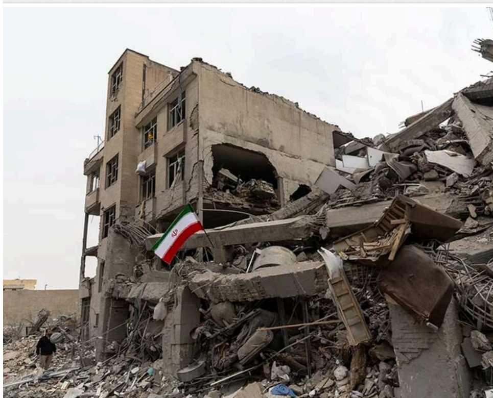
"Мозаїчна стратегія" Тегерана: Bloomberg пояснив, як Іран зберіг боєздатність після ударів США та Ізраїлю

Іран зміг суттєво зменшити шкоду від американо-ізраїльських атак завдяки заздалегідь розробленому плану військових дій, повідомляє Bloomberg.