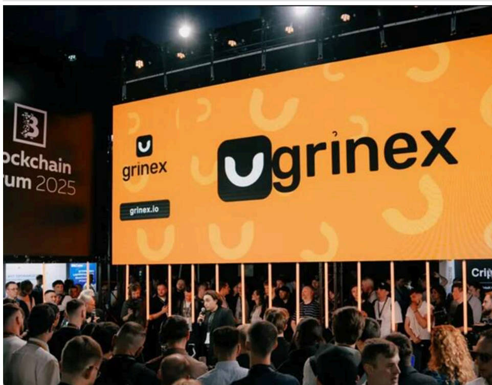
Злам Grinex на 1 мільярд: росЗМІ повідомляють про крадіжку активів у користувачів підсанкційної платформи

Росіяни втратили близько 1 мільярда рублів: зламана криптобіржа Grinex, що перебуває під санкціями.