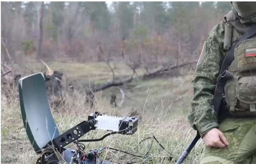
Російський термінал зв'язку Спирит-030

Спирит-030 зроблений переносним і працює зі спеціальним геостаціонарним супутником зв'язку, що дозволяє використовувати антени не 90 сантиметрів у діаметрі, а 30, зауважили у Міноборони.