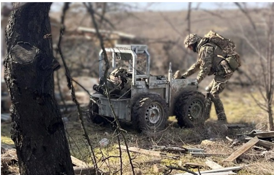
Збройні сили України продовжують чинити опір російській агресії

Більш ніж половину з цих атак російські окупанти здійснили на Покровському та Костянтинівському напрямках.