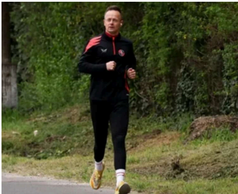
Перша поява після поразки: Петера Сійярто помітили на пробіжці після кількох днів мовчання

Угорські журналісти 16 квітня помітили міністра закордонних справ Петера Сійярто, який після поразки партії «Фідес» на парламентських виборах не робив жодних публічних заяв.