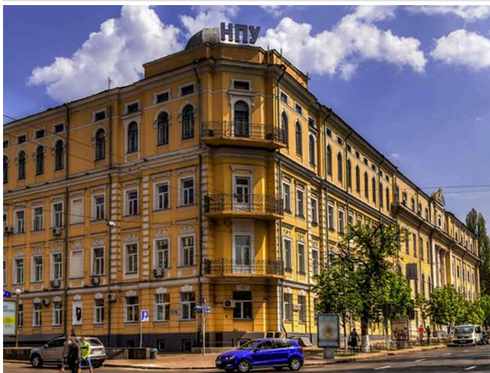
«Сарай із пропискою»: в мережі показали жахливий стан укриття в гуртожитку університету Драгоманова

У мережі продемонстрували стан укриття в одному з гуртожитків університету імені Драгоманова в Києві. Приміщення не придатне для тривалого перебування людей.