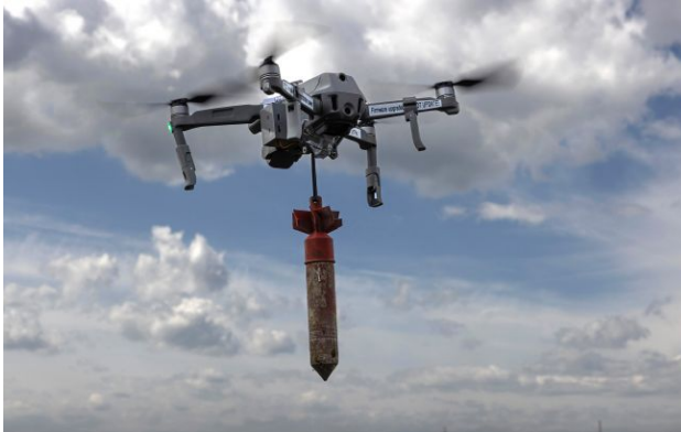
Фото: війна в Україні є рушієм безпілотних технологій (Getty Images)

Обирайте перевірене - додайте РБК-Україна до улюблених джерел у Google