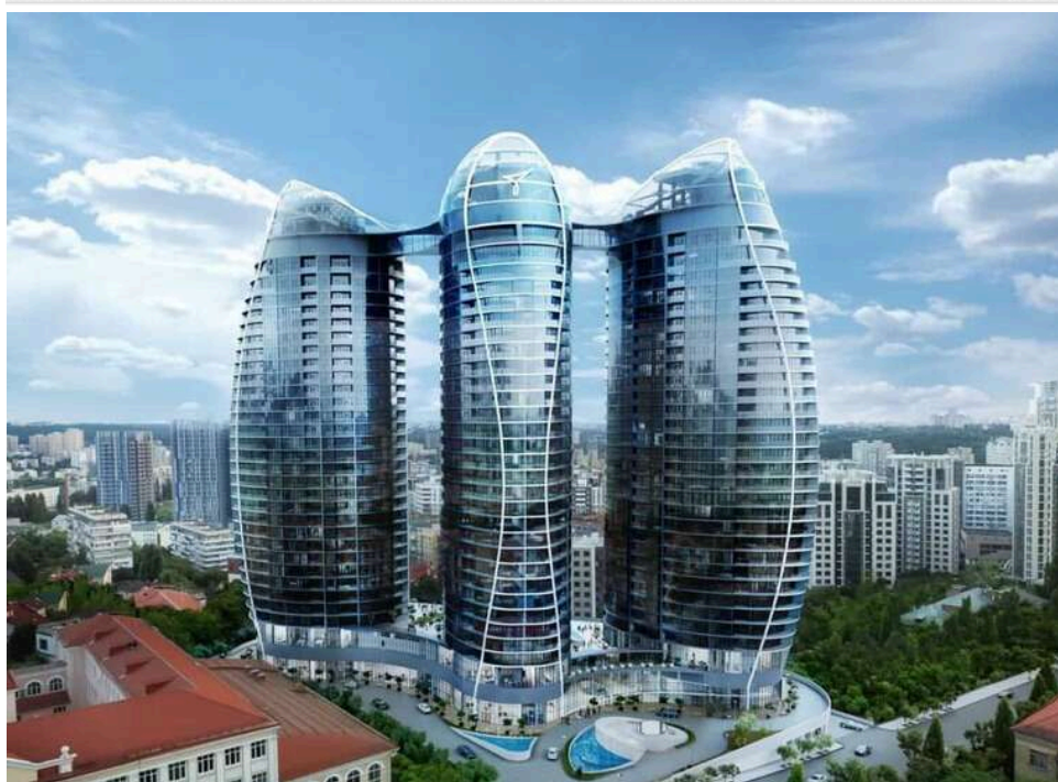
Элитные квартиры для «чужих денег»: Taguan Towers как площадка для мошенничества и легализации «грязных» капиталов

Пока Украина живет в условиях войны, экономии и постоянных сборов на армию, в центре столицы продолжают сделки на сотни тысяч долларов. В одном из самых дорогих жилых комплексов страны – Taguan Towers – квартиры покупают люди, чьи официальные доходы не позволяют приблизиться к таким суммам даже теоретически.