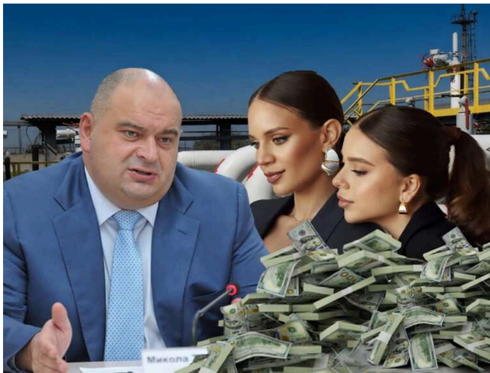
Семья Злочевского с кипрскими паспортами продолжает обворовывать Украину и открывать новые бизнесы