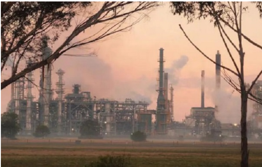
В Австралії сталася масштабна пожежа на НПЗ

Пошкодження внаслідок пожежі посилили побоювання щодо постачання бензину в країні на тлі глобальної паливної кризи.