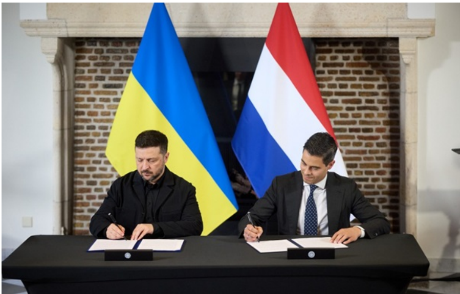
Зеленський зустрівся з прем'єр-міністром Нідерландів

Drone Deal між Україною та Нідерландами - це стратегічна ініціатива, яка передбачає спільну розробку та виробництво дронів, ракет, систем радіоелектронної боротьби.