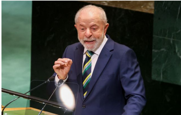
Фото: президент Бразилії Луїс Інасіу Лула да Сілва

Бразилія ніколи не підтримувала Росію у війні та не визнавала її право окупувати території України. Але завжди виступала за припинення війни через переговори.