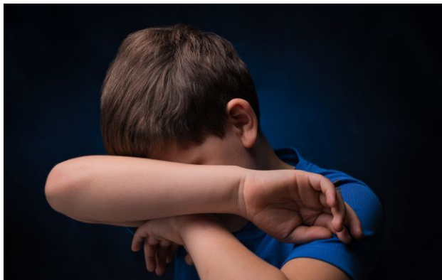
Фото: У Львові вчительку підозрюють у цькуванні семикласника (Getty Images)

У Львові в одній зі шкіл розгорівся скандал через можливе цькування учня, батько якого служить у ЗСУ. Рідні зазначають, що вчителька української мови систематично ображає дитину.