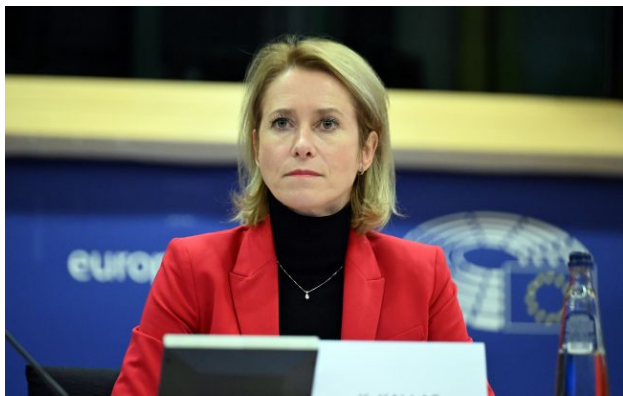
Фото: Кая Каллас (GettyImages)

Вже наступного тижня Рада ЄС із закордонних справ розгляне питання щодо кредиту Україні у розмірі 90 млрд євро та 20-го пакета антиросійських санкцій.