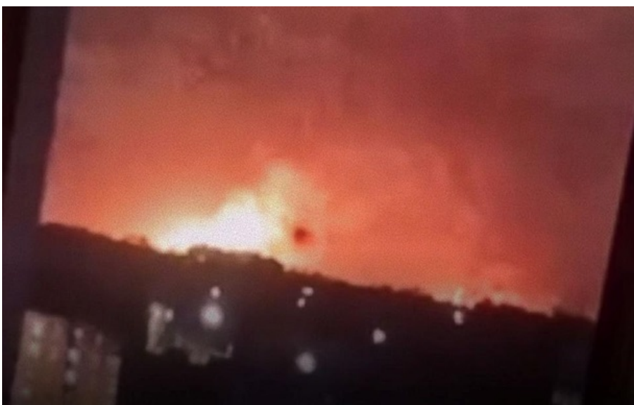
Пожежа на НПЗ у Кстово

Також вдалося уразити склад зберігання російської авіаційної техніки в місті Саки у Криму.